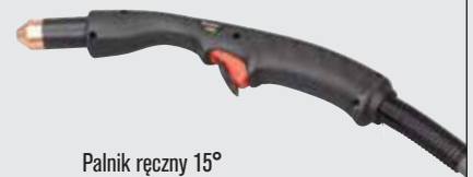
Palnik ręczny 15°