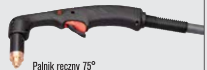
Palnik ręczny 75°

(więcej opcji palników można znaleźć w witrynie www.hypertherm.com )